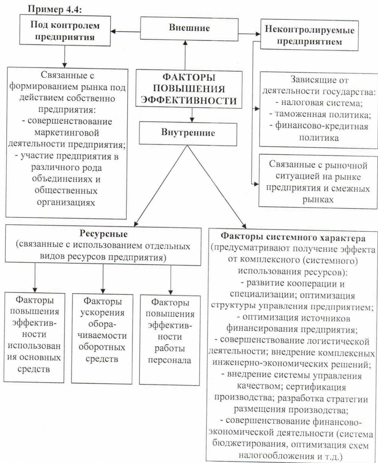
Рисунок 1.2 – Классификация факторов повышения эффективности деятельности предприятия

состоит из номера раздела и порядкового номера таблицы, разделенных точкой. Например, «Таблица 2.1» – первая таблица второго раздела. Таблица должна иметь название, которое пишут строчными буквами (кроме первой прописной) и помещают над таблицей с левого края текста. Между номером таблицы и названием проставляется тире. Между названием таблицы и самой таблицей не должно быть пустой строки. Однако таблица должна быть отделена от предыдущего и последующего текста пустыми строками.